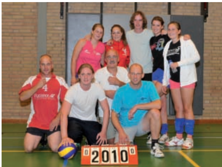
Winnaar Zomeravondtoernooi 2010 DE EDELE STENEN