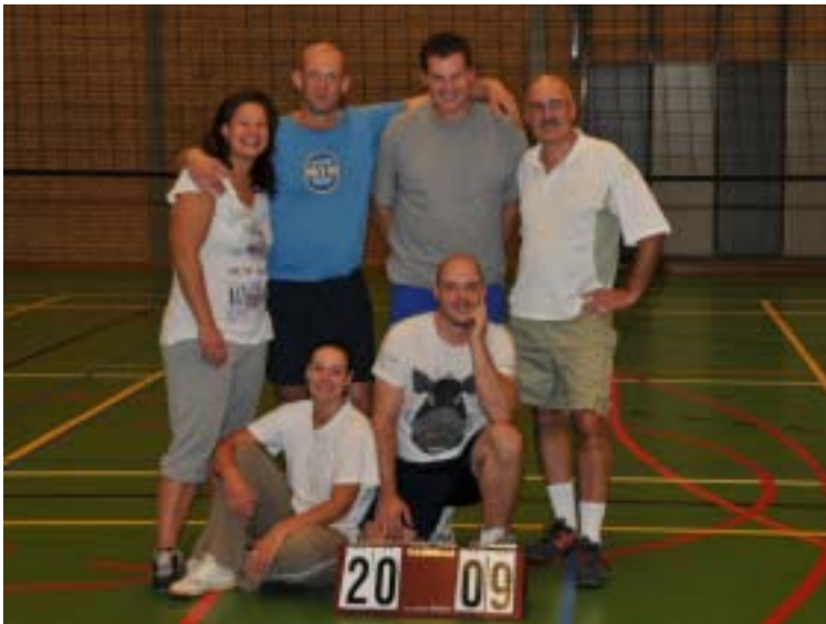
Winnaar Zomeravondtoernooi 2009 BOMMELDING

Het team van de Natte Navels eindigde in de winnaarspoule met de meeste punten. Een knappe prestatie gezien het hoge aantal niet volleyballers in het team. Doordat de reglementen minimaal 2 heren/dames vereisen, en omdat in het begin met 1 dame en later geheel zonder dame werd gespeeld, werd het team van de eerste plaats naar de tweede plaats teruggezet. Door deze reglementaire correctie werd uiteindelijk Bommelding, dat het toernooi ook vorig jaar won, eerste. De wisselbeker, welke na 8 jaar al aardig aan het slijten is, werd deze keer definitief aan de winnaar overhandigd.