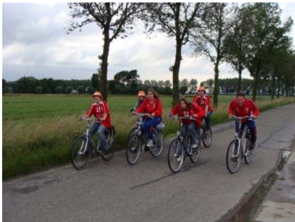
De dappere ridders van Phoenix trekken ten strijde