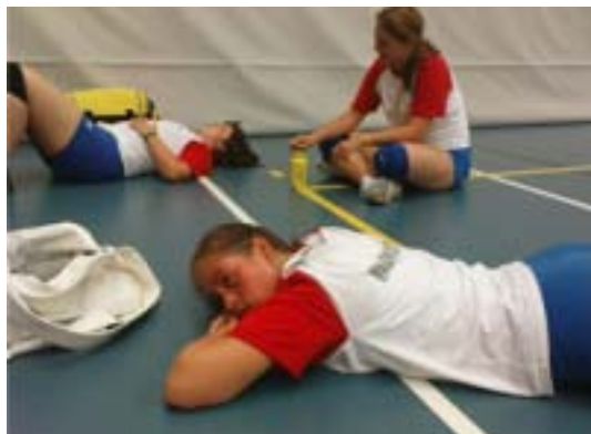
The day afer...