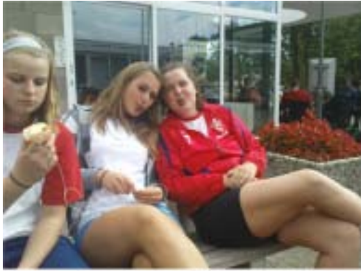
Baby and the Apple