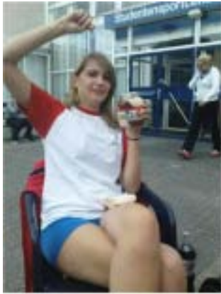
Kill and attack!!!