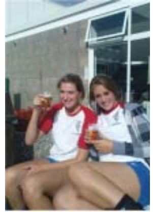
Bestel mar, bestel mar, bestel mar!