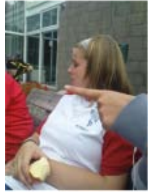
Talk to the finger!